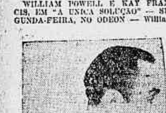
William Powell, em "A unica solucao", film do Warner-Frist

lido neste romance, e já malta poderia ser tratado com tanta delicadeza e honra que é o de todos os dias e todas as idades.